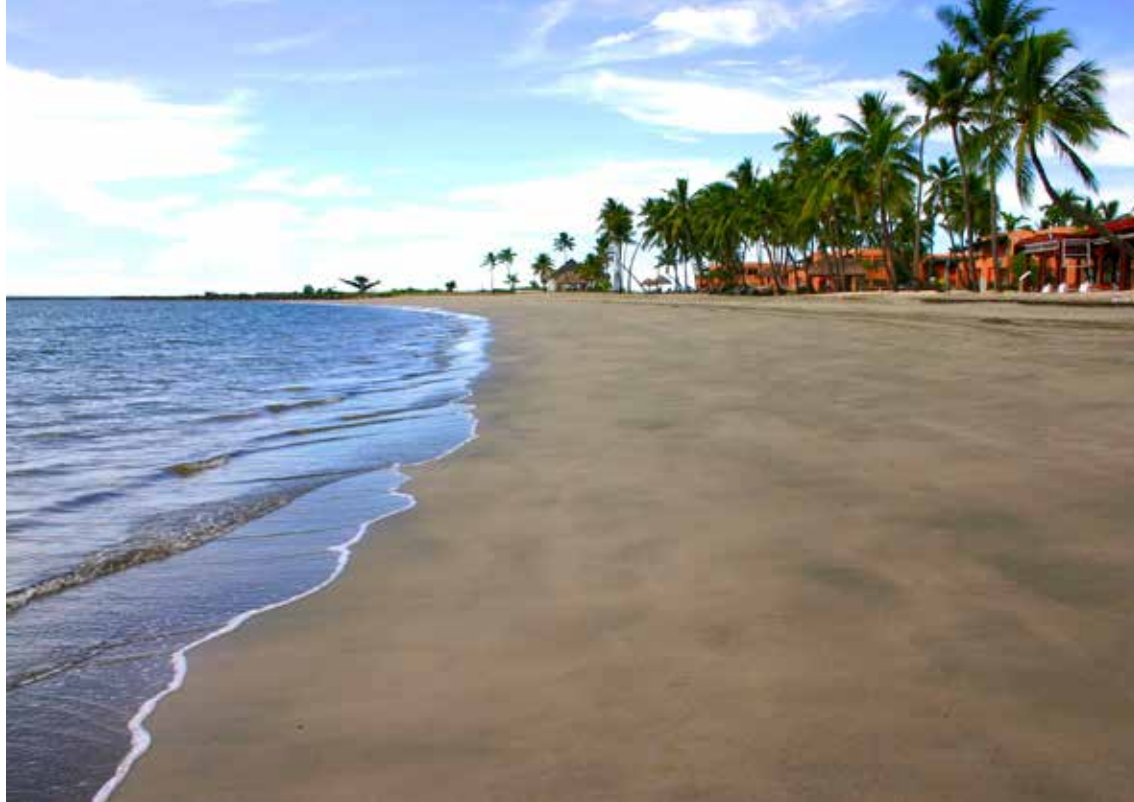
Plaža na otoku Viti Levu