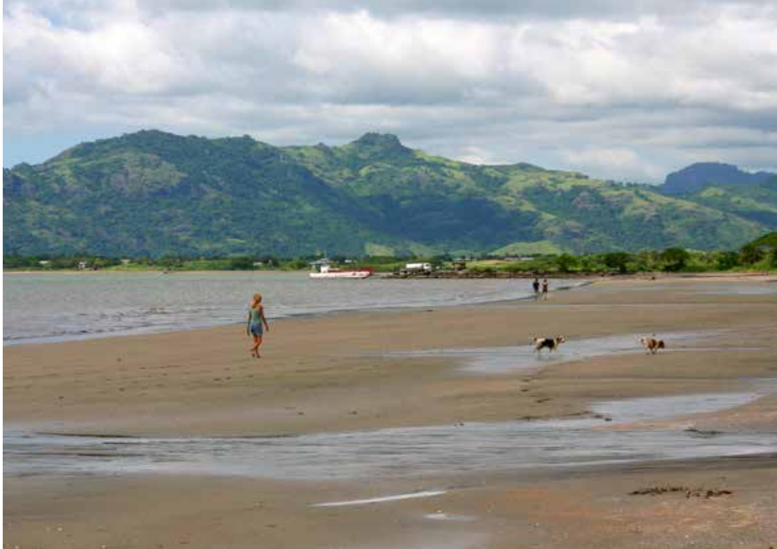
Plaža na otoku Viti Levu