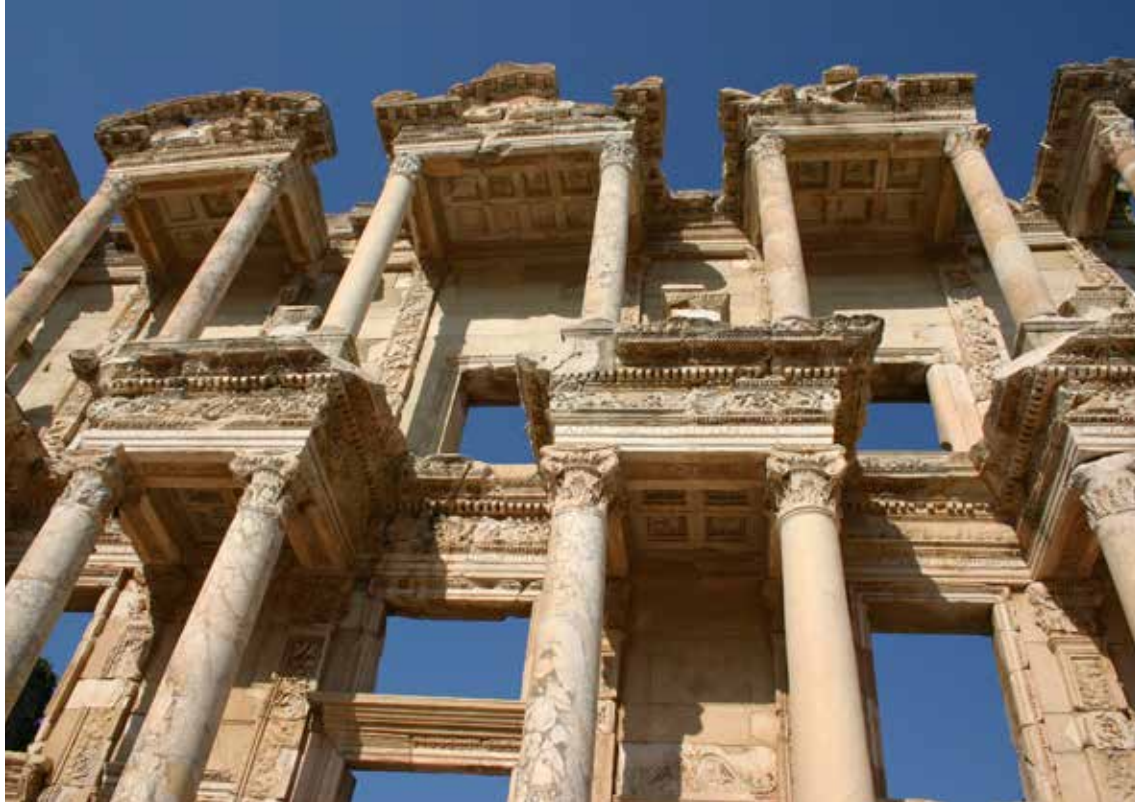
Antično mesto Efez