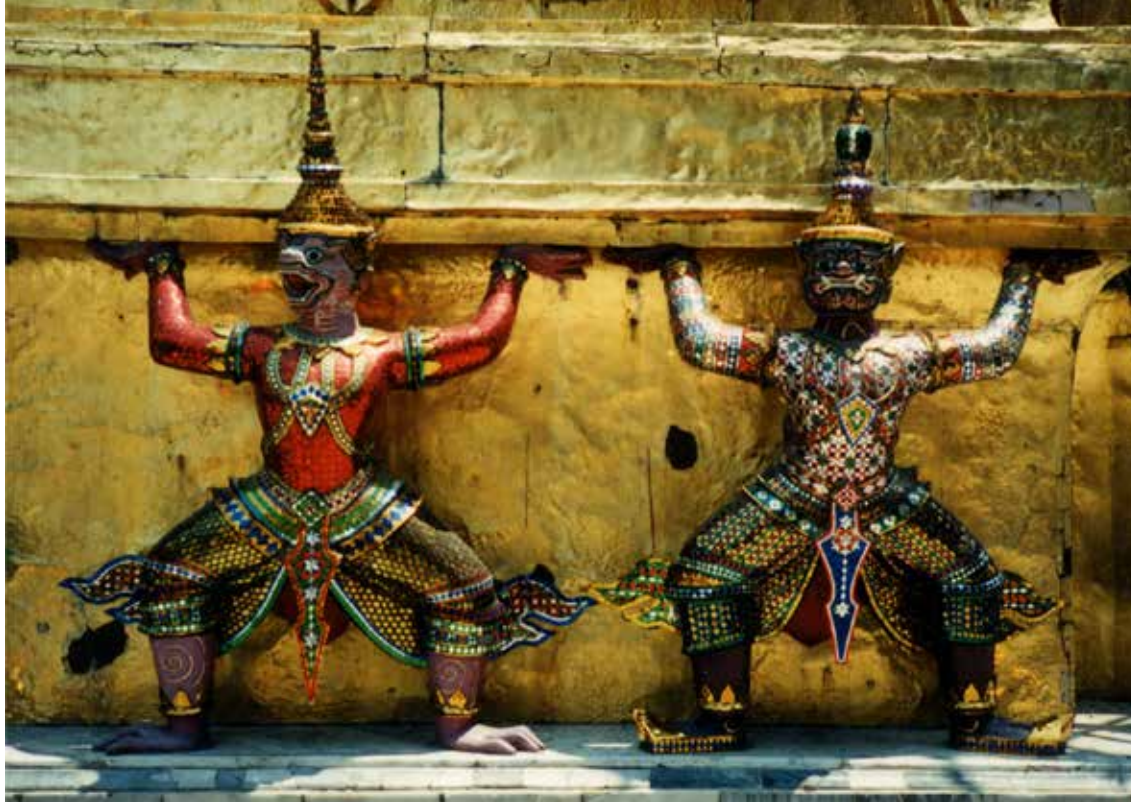
Vojščaka templja Wat Arun

najboljše, saj sem izredno izbirčna. Tako različna je bila, da je lahko vsak, celo jaz, našel kaj zase. Za meso v omakah se pravzaprav ni vedelo kaj je, saj so vse bedrce tako majhne, da ne veš ali je ptič ali kura, ha, morda še kaj drugega. Omake so zelo začinjene posebno s čilijem, kar je za ta konec sveta značilno.