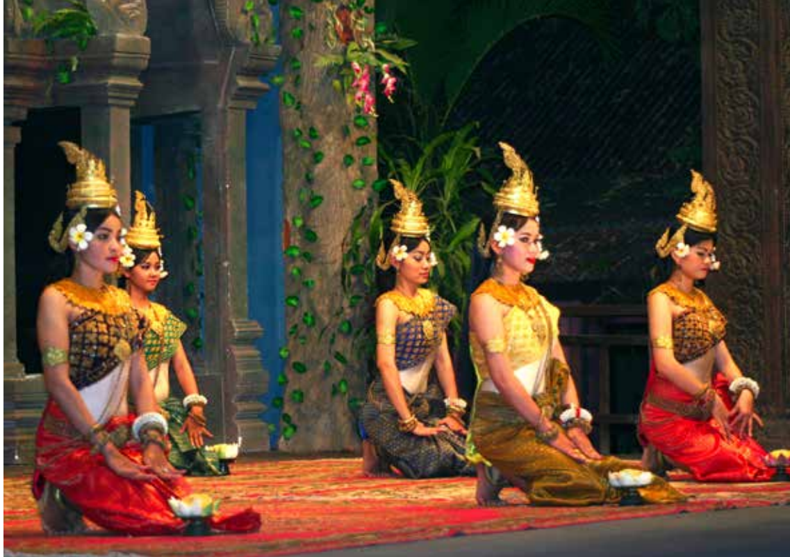
Predstava v Siem Riepu

najprej vpraša za plačilo, sicer jih dajo na oddelek za reveže, kjer imajo le najnujnejšo oskrbo. Zato se v večini poslužujejo kitajskih alternativnih zdravilcev. Pokojnin ni, če jim uspe poskrbeti za prihodnost, jim ni treba delati do smrti.