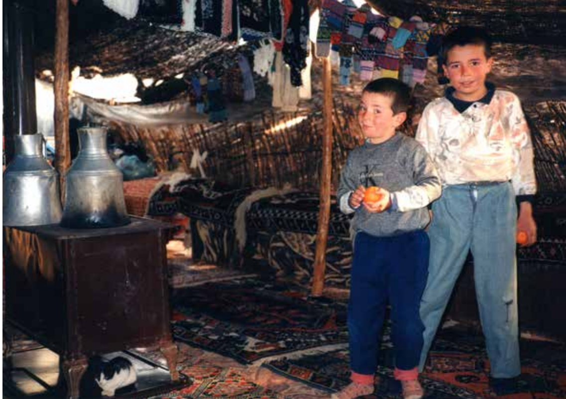
V nomadskem šotoru