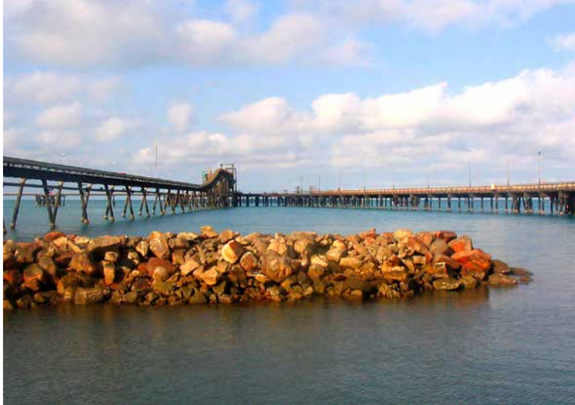
Pristanišče za natovarjanje v mestu Alyangula