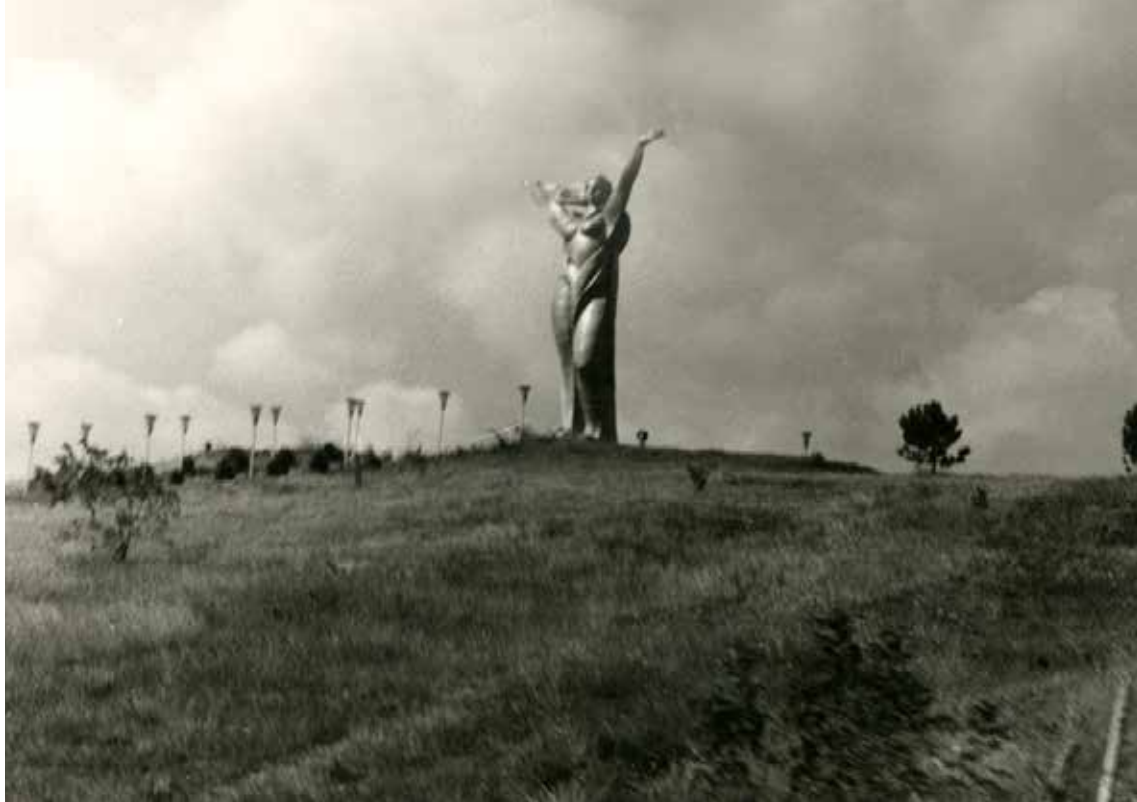
Spomenik matere Gruzije