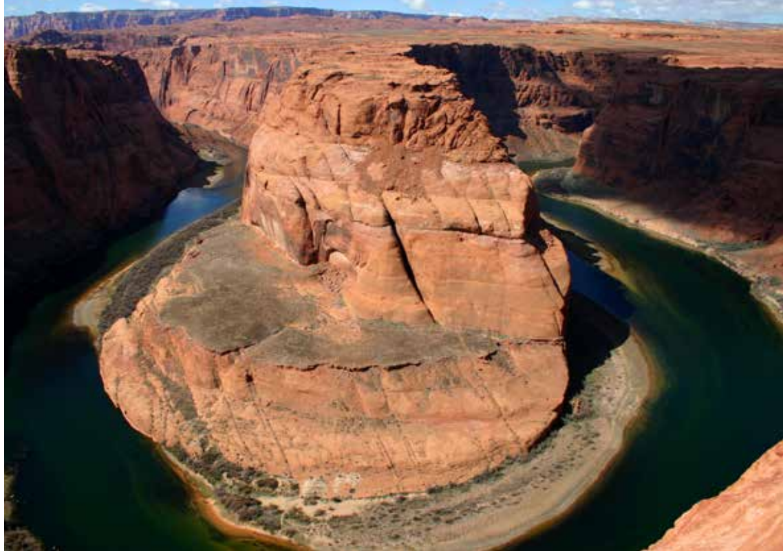
Horse - shoe