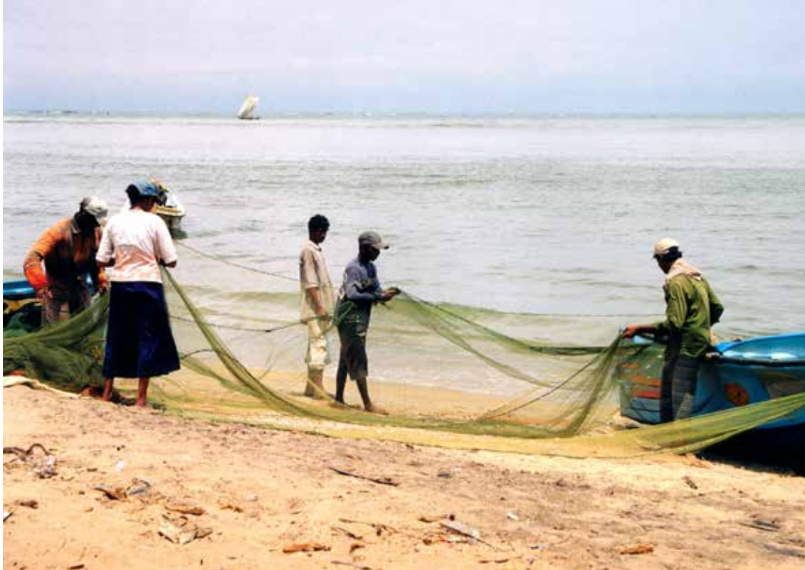
Ribiči v Negombu (nagrajena fotografija)