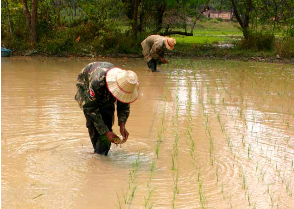
Sajenje riža, Siem Riep