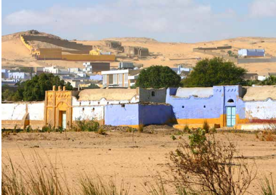
Nubijska vas blizu Aswana