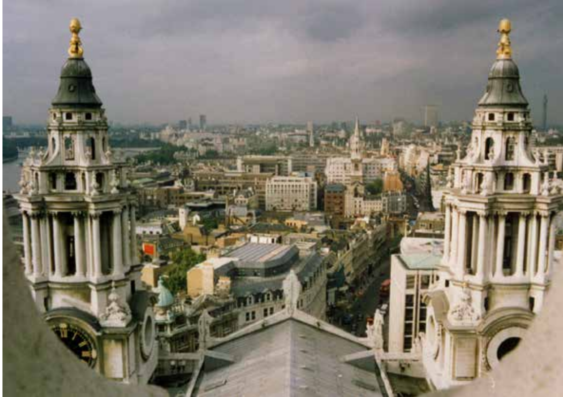
Pogled iz katedrale sv. Pavla v Londonu