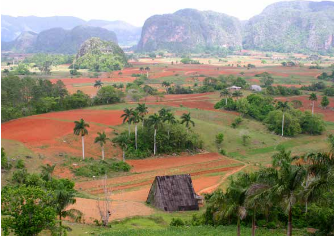
Pinar del Rio

mimo številnih prepovedi. Slišala sem, da si mladi želijo v Ameriko, mi tujci pa nasprotno želimo videti Castrovo Kubo, dokler bo takšna, dokler se ne bo odprla tujemu kapitalu.