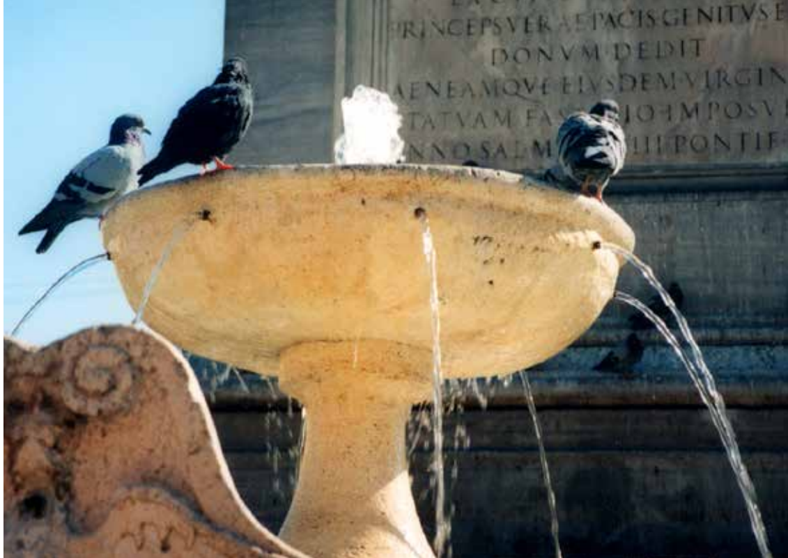
Del vodnjaka v Rimu

Videli smo del Antičnega Rima, tisti veličastni elipsasto okrogel objekt, ki krasi prestolnico Italije, in ki spominja na gladiatorske boje, šport tedanjega časa, kolosej, ki je največji v vsem rimskem cesarstvu. Doživeli smo del srednjeveškega Rima, srednjeveška stolpa, ki še komaj stojita ob baziliki z ogromnim stopniščem. In del tistega prvinskega Rima, kjer iz zemlje štrli še nekaj akropolskih stebrov, ki jih pridno uničuje zob časa. Mimo je švrknil rimski vojščak v oklepu in z rdečim ogrinjalom ter metli podobnim repom na čeladi. Ste ga videli? Ne smemo pozabiti na podobe volkulje z dojenčki, ki ponazarja začetek Rima. Sinova, dvojčka Romul in Rem sta bila odložena ob reki Tiberi, a ju je z dojenjem rešila volkulja, potem ju je našel neki pastir, ju hranil, ko sta odrasla, sta prišla na enega od rimskih gričev, in ustanovila Rim, potem je Romul ubil Rema. A ta zgodba, ki jo zaradi upodobitev vidiš povsod po mestu, ni prava zgodovina. Rim so ustanovili Latini, zaradi obrambe pred Etruščani. V zgodovini se je tam dogajalo še marsikaj, bilo je cesarstvo in mesto je bilo požgano. Danes v mestu živi kakšne tri milijone prebivalcev. Je večno in očarljivo, s pridihom antike, posejano s spomeniki, fontanami, parki, v njem je prava zakladnica izrednih umetnin.