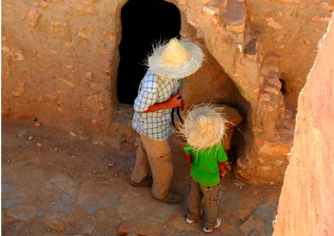
Hotel Ksar Hedada