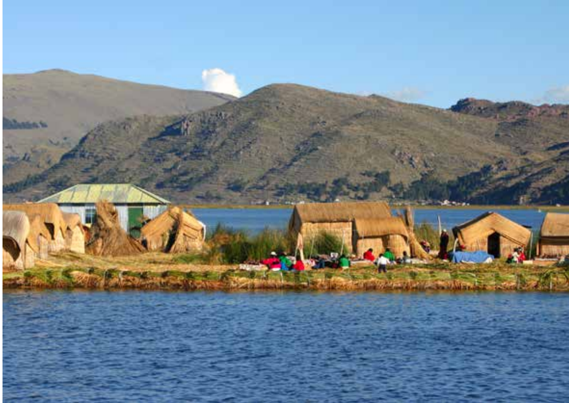
Plavajoči otoki na jezeru Titikaka