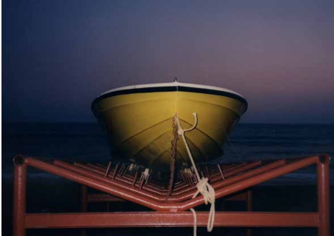
Antalya – privez (nagrajena fotografija)

Prišli smo iz štirih držav, od tega štirje Slovenci, od dvajsetih pa tja do sedemdesetih let. Zanimivo pri tem je, da sta dve Jeseničanki dobili križarjenje za darilo ob svojih življenjskih jubilejih. »Kaj nam pa morejo,«, sta si rekli in se napotili v neznano. Tam je bilo tudi šest balinarskih klubskih tovarišev iz Bremna, drugi pa parčki brez otrok.