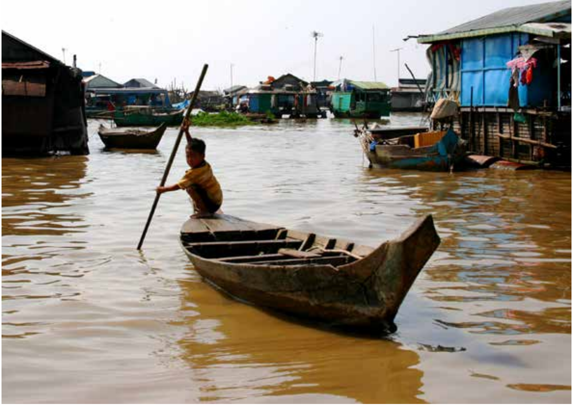
Plavajoča vas na Mekongu

pozornost nehote usmeriš na dolge okrivljene prste na rokah, ki jih prefinjeno in umeteljno sučejo in krivijo nazaj. S tem poudarjajo tradicionalna čaščenja bogu Višnuju.