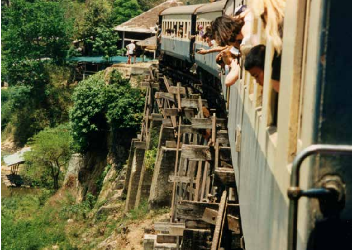
Proga Kanchanaburi proti mostu na reki Kwai