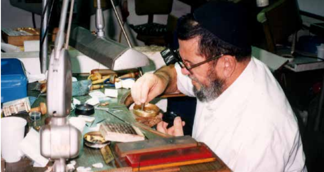
Pri obdelavi diamantov (nagrajena fotografija)

na Bližnjem vzhodu se je z njihovim prihajanjem porušilo in tako je še danes. Prišleki so se najprej naselili v pristanišče Haifo, ki je mesto velikih herojstev. Danes so Judje vso ravnino ob obali spremenili v oazo življenja. Kibuci so imeli pri tem spreminjanju okolja pomembno vlogo. Povratniki, ki jim ni bilo ljubo delo na zemlji, so se naselili v mestih in se zaposlili v industriji. Tako je zrasla Haifa v močno industrijsko središče.