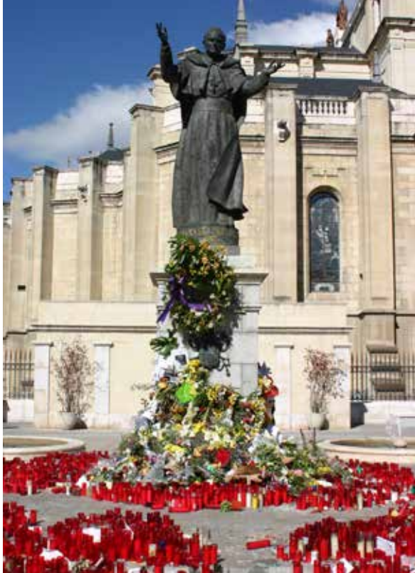
Katedrala na trgu Plaza Mayor, Madrid