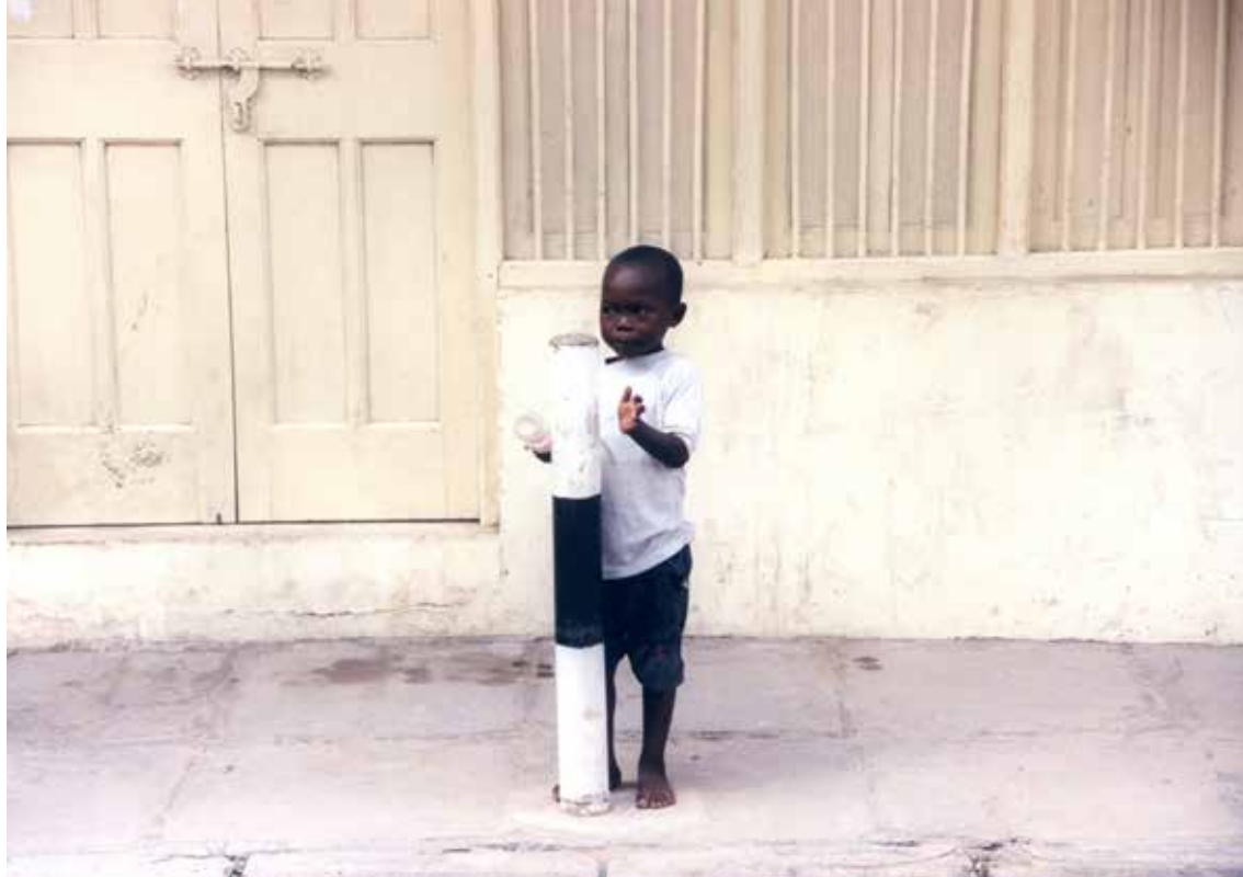
Deček, Mombasa (nagrajena fotografija)

V hotelskem kompleksu je bilo stalno polno opic. Tekale so sem in tja in večinoma pričakovale hrano. Turisti so jih razvadili. Tako ni bilo varno ničesar puščati na balkonu, saj so opice spretno vse odnesle. Park je bil kot safari malih živali, različnih lepih ptic in papig, kameleonov, stonog velikank, pod slamnato streho vhoda v hotel Paradise Beach pa so se ugnezdili netopirji. Uživala sva v sprehodih, plavanju v bazenu, ki ima na sredi bife in dobri hrani štirikrat dnevno. Včasih sva opazovala, kako so nekateri zaposleni sadili travo, tisto trdovratno travo, ki jo pri nas mečemo ven iz angleške trave. Vsako bilko so sadili posebej. To se mi je zdelo prav noro. Tisto, kar tukaj naredijo trije, pri nas naredi en zaposleni. Tako imajo vsi delo in nekaj zaslužka. V naselju so se res trudili in uprizarjali vsak teden kakšno prireditev, da bi nam turistom krajšali čas. Glasbene in akrobatske skupine so imele svoje šove kar na poti med hoteli, postavljali so slikarske razstave, organizirali so vrtno tržnico s pokušino afriških dobrot in s pokušino drugih sposobnosti, na primer lovljenja rib na suhem.