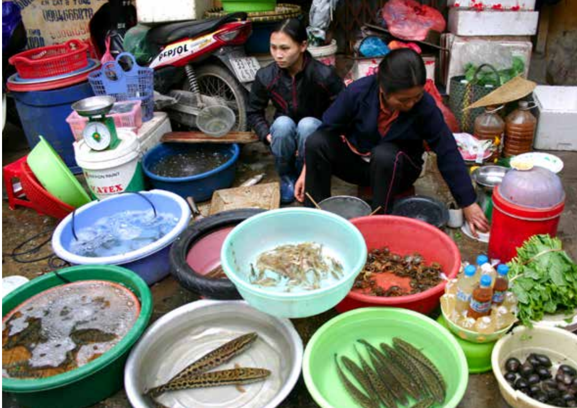
Hanojska tržnična ponudba

prometa nisem doživela nikjer drugje. No, vse ni tako čрно, saj se sčasoma privadiš razmeram, potem pa ti je to celo v zabavo, čeprav nevarno zabavo. Zabavni so lahko celo rahli trki, najraje dveh motoristk ali voznikov avtomobilov, sploh glasno prerekanje in komentarji očividcev. Ko bi le znala malo vietnamsko, da bi razumela.