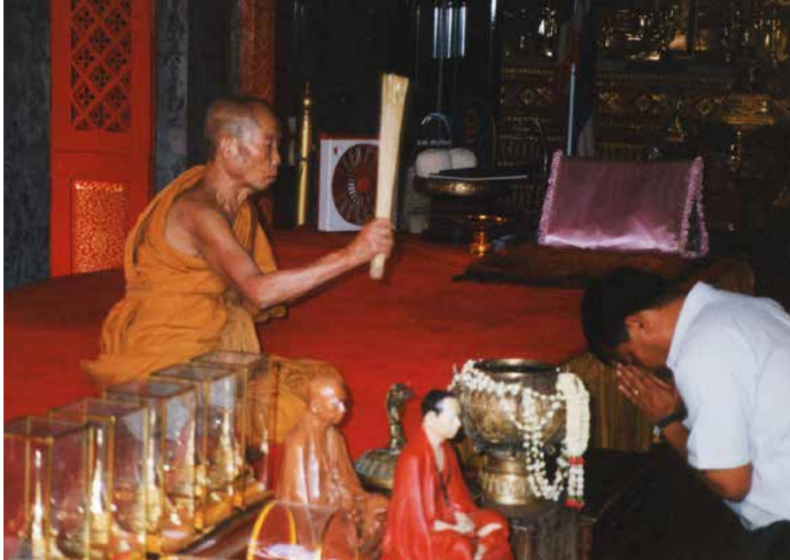
V templju Wat Prathat

na ogled kadar koli, ne da bi se zmenili za številne turiste, ki se peljejo mimo v čolnih in jih fotografirajo in snemajo. Tudi mi. Vodnik nam pove, da takole, na ta način, živi približno tri milijone ljudi. Ob kolibah opazim drogove z električnimi vodi. Med potjo si ogledamo pagodo jutranje zarje Wat Arun, ki je zanimiva zaradi številnih kipcev na fasadi v obliki vojščakov, ki na enem kolenu in z rokami podpirajo strop nad sabo. Noben tempelj pa se po lepoti in bogati opreми ne more kosati s kraljevo palačo. Palača je danes muzej, poln kraljevske opreme in orožja. Tempelj skriva smaragdne Budo, ki je 75 centimetrov visok kip iz enega kosa zelenega žada. Ob menjavi letnih časov mu že od leta 1464 zamenjujejo obleko, stkano iz zlata in draguljev. Dejstvo je, da tako bogato okrašene tempeljske relikvije ne najdeš nikjer na svetu. Še drevesa v parku okrog kraljeve palače so ostrižena v obliki streh pagod.