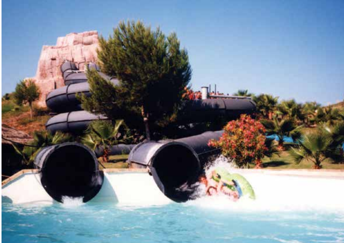
Vodni park El Arenal