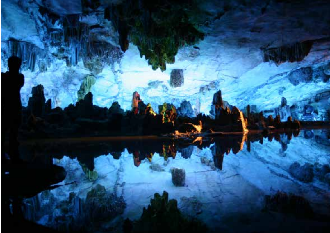
Podzemna jama v Yangshuo (nagrajena fotografija)

Vendar, ko sva stopila v eno in potem še v drugo turistično agencijo v Guilinu in želela informacijo, kje lahko kupiva razglednice mesta, je bilo razumevanje nepopolno oziroma ga ni bilo. Da ne pišem o taksistih. Ti so številni, vendar le malokdo zna vsaj eno besedo v tujem jeziku. Nekega taksista sva v starem Pekingu (Hutongu) z zemljevidom v roki prosila naj naju pelje v znano nakupovalno središče Silk Market. Oboji smo mislili, da smo se razumeli, a pripeljal naju je daleč stran od cilja pred neko vladno ustanovo, ki so jo stražili oboroženi policisti. Komaj sva mu dopovedala, da naju pelje do najinega hotela. No, tega je našel s pomočjo posvetovanja z nekom po mobilnem telefonu. Všeč pa nama je bila njegova poštenost, da nama od napačnega cilja do hotela ni računal.