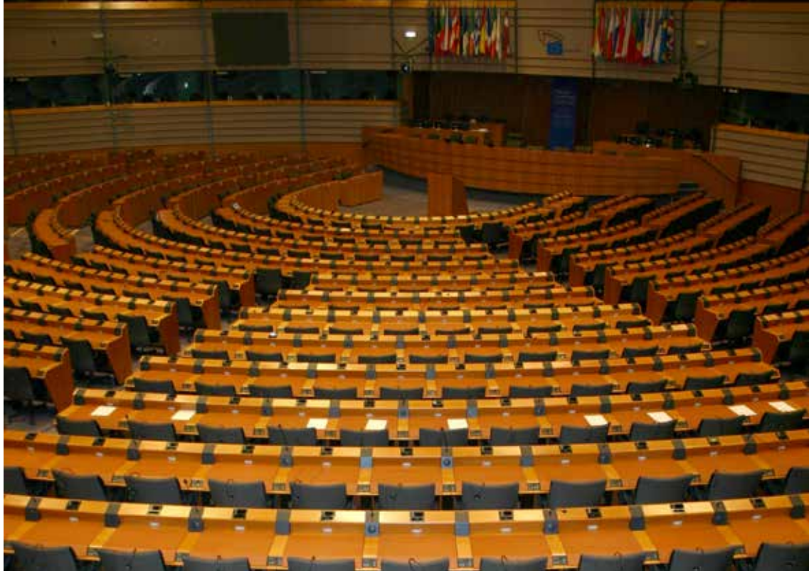
Evropska parlamentarna dvorana, Bruselj