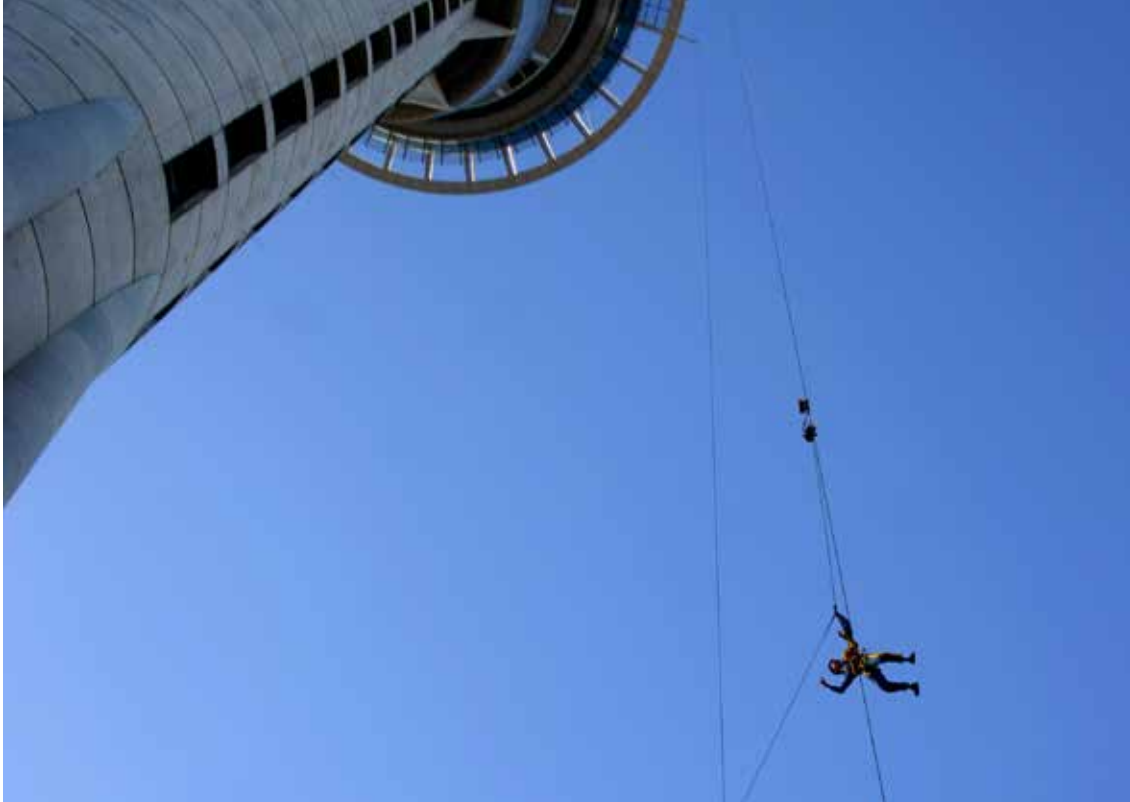
Spuščanje z razglednega stolpa v Aucklandu

Londonu moraš prositi, moledovati, v Novi Zelandiji pa ti pomagajo in spremljajo do izhodnih vrat. Morda je za dober razplet pomagal pajek, ki ga je soprog pustil živeti pred odhodom zjutraj doma.