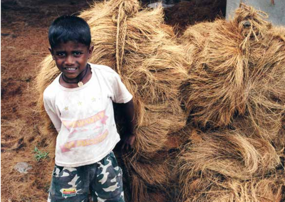
Deček ob kokosovih vlaknih (nagrajena fotografija)