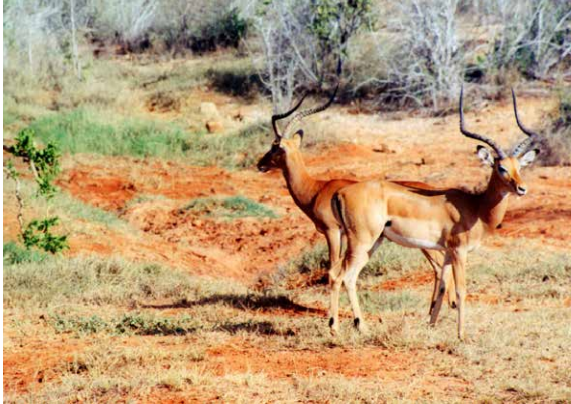
Nacionalni park Tsavo