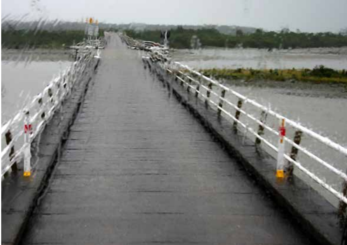
Most z izogibališčem v Haastu

sva bila v hotelu tik ob termalnih vrelih Te Puia, kjer iz zemlje bruha vroča voda in brbota blato. Termalni park imajo v lasti Maori, v njem pa je inštitut za umetnost, kjer prikazujejo izdelovanje lesenih totemov in oblačil iz listov rastlin. Maorska vodnica nama je predstavila najdaljšo besedo na svetu, sestavljeno s petintrideset črk v njihovem jeziku, kar približno pomeni zbiranje moaorskih vojščakov. Po mestu je še več parkovne površine in skoraj iz vsakega grma se je kadilo, kot da bi celo mesto ležalo na gejzirjih. Ob raziskovanju sva se znašla v mestnem klubu, kjer sva dobila pivo šele, ko sva se vanj brezplačno včlanila. Tam se domačini zabavajo z različnimi družabnimi dejavnostmi kot so skupinski ogled tekem, karaoke, igranje na igralnih napravah, biljard, bowling, fitnes in prirejanje rojstnodnevnih zabav.