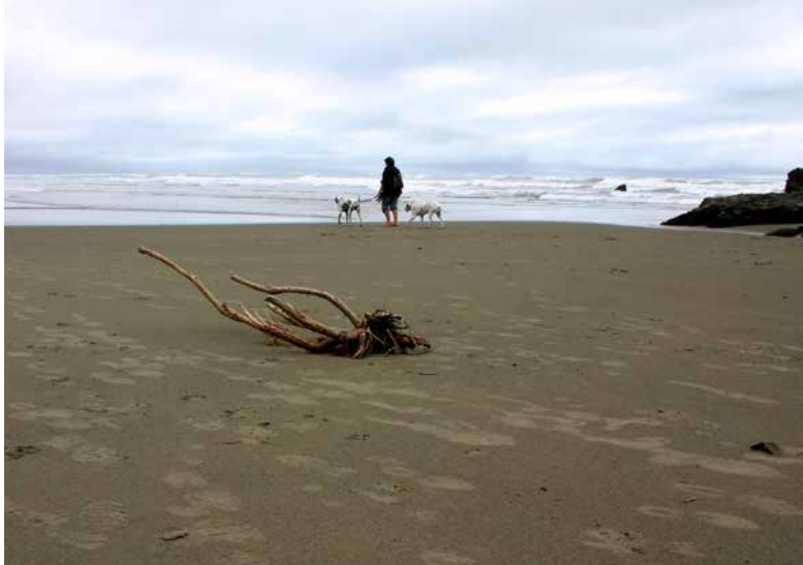
Obala nedaleč od Christchurcha