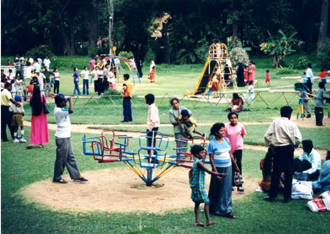
Kandy (nagrajena fotografija)

Iz templja sva odšla na predstavo, kjer turistom prikažejo njihove obredne in celo bojne pleses z velikimi maskami na glavah. Zaradi rdečega jezika so maske nekoliko podobne našim kurentovim. Med plesom izvajajo tudi akrobatske veščine, z vrhuncem – hojo po žerjavici. Takšne maske, ki jih imajo plesalci, lahko v različnih velikostih kupiš v številnih trgovinah po državi. Narejene so iz lahke ebenovine ali težke gline. V takih trgovinah je na voljo vrsta različnih Budovih kipcev, okrašenih slonov, izdelkov iz izrezljanega lesa, doma narejenih vezenin, iz številnih zdravilnih zelišč in dišavnic narejene kreme in olja ter drugih reči, ki jih turisti kupimo za spomin. Čudoviti so tudi dragulji iz njihovih rudnikov. Ob obisku ene od trgovin z olji so naju pošteno zmasirali tudi z nakupom. Olje za hujšanje, boljši vid, potenco? Ne vprašajte, če pomaga.