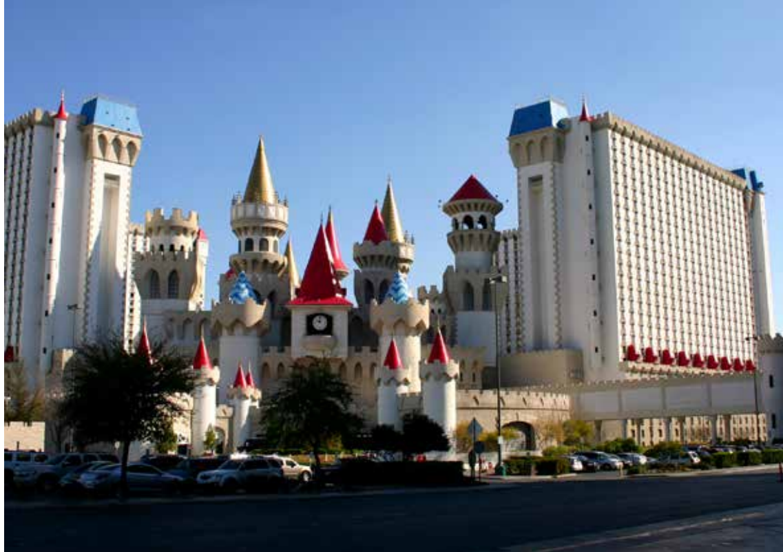
Hotel Excalibur, Las Vegas

Ljudje živijo sredi kamnite pokrajine? Cesta je bila odlična, z malo prometa. Našla sva pot do »Konjske podkve«. Kako čudovit zavoj okrog gore je naredila reka Kolorado, ki je tam sinjemodra. Sonce za dobro fotko ni bilo na pravi strani, a me to ni motilo. Uspelo mi je videti tudi čudovite kamnite rdeče zavese v Antilopa canyonu. Ustavila sva se še pri mogočni hidroelektrarni in nadaljevala pot proti mestecu Kanab, kjer imajo s prikazom nekdanjih šotorov in kočij divjega zahoda kar mali Hollywood. Prenosišče sva našla v Springdalu poleg Zion Canyon, ki je prav tako osupljivo lep.