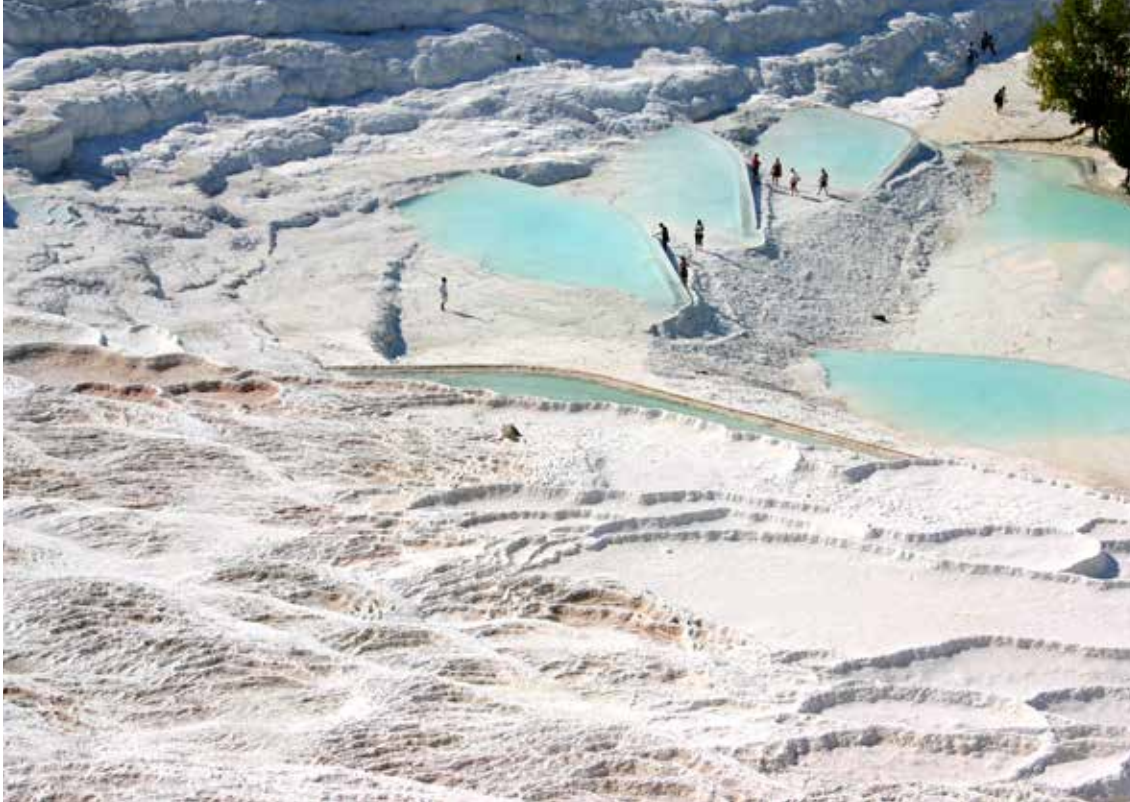
Pamukkale (bombažni grad)

Prenočevali smo večinoma v hotelih visoke kategorije, najboljši je bil Onyria Claros hotel blizu Izmirja. Hotelski kompleks z depandansami sprejme preko tisoč obiskovalcev, ima čudovito plažo in šest različnih zunanjih bazenov za vsak okus. Tudi ponudba hrane je obilna in odlično pripravljena. Vsak dan ponujajo izjemno veliko različno pripravljene zelenjave, veliko solat in sadja. Tako se večinoma prehranjujejo tudi Turki. Veliko pojedjo zelenjave in sadja, mesa pa bolj malo.