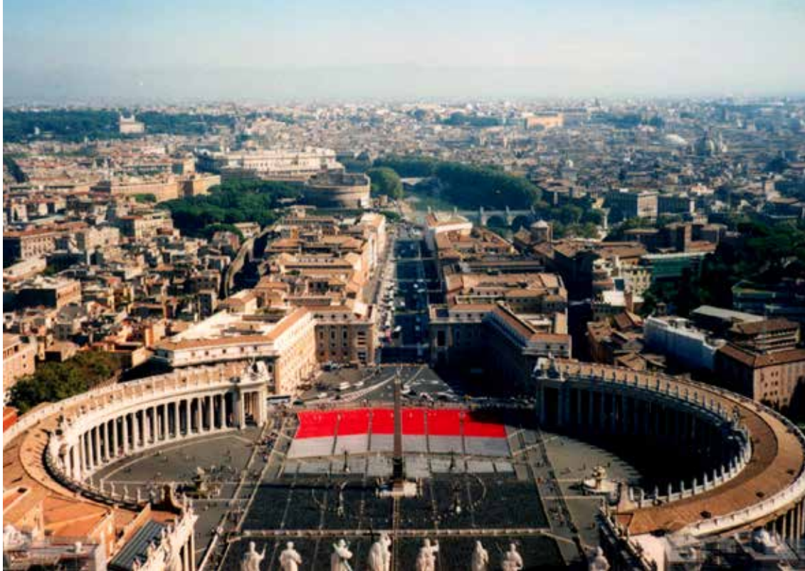
Pogled na Rim iz cerkve sv. Petra