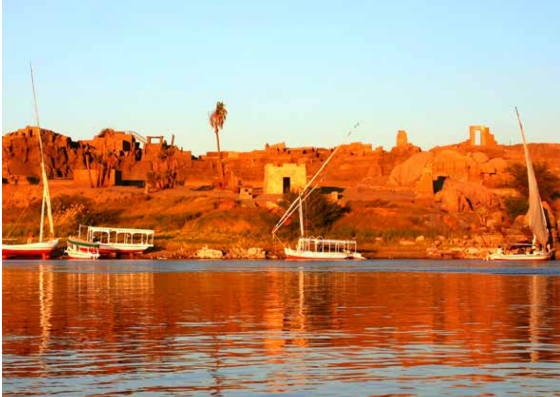
Feluke na Nilu