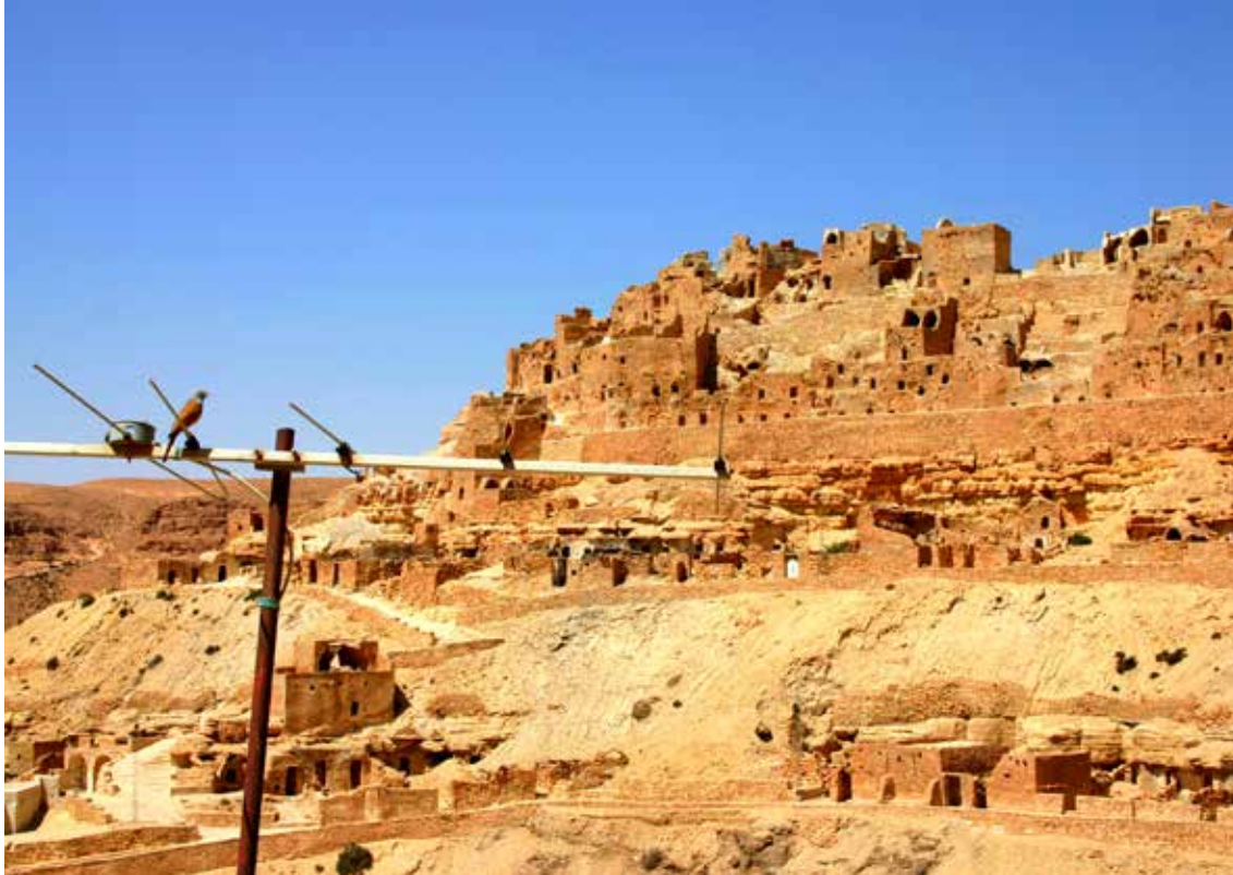
Puščavska vasica Chenini