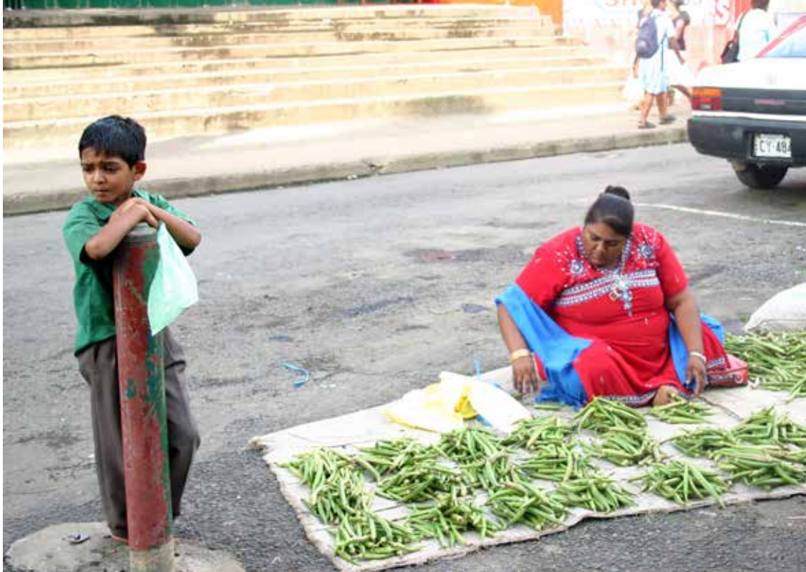
Branjevka v mestu Nadi