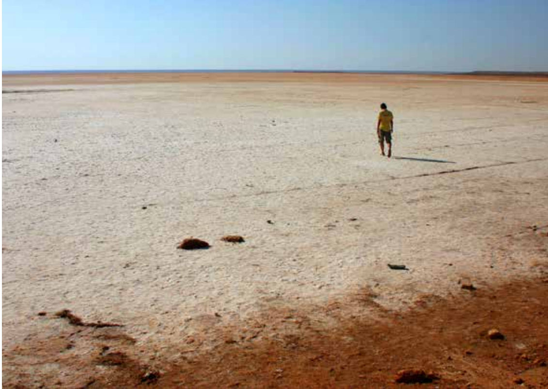
Slano jezero Shott

Med potjo sva v oljčnem nasadu videla preprosto podzemno oljarno, ki so jih uporabljali v starih časih.