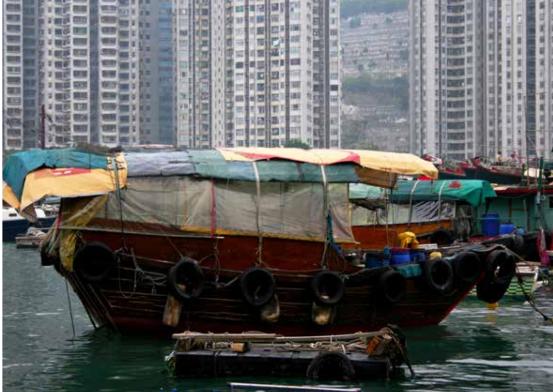
Plavajoča domovanja, Hong Kong

žalnim trakom. Nedaleč proč je drugi velik trg Plaza de Espana, kjer sva si iz vseh strani ogledala velike bronaste kipe Don Kihota, Sancho Panse in njunih konja in osla, spomenik v spomin ravno pred 400 leti napisanemu romanu španskega romanopisca Michuela Cervantesa. Okrog spomenika so na gredicah cveteli živorumeni tulipani.