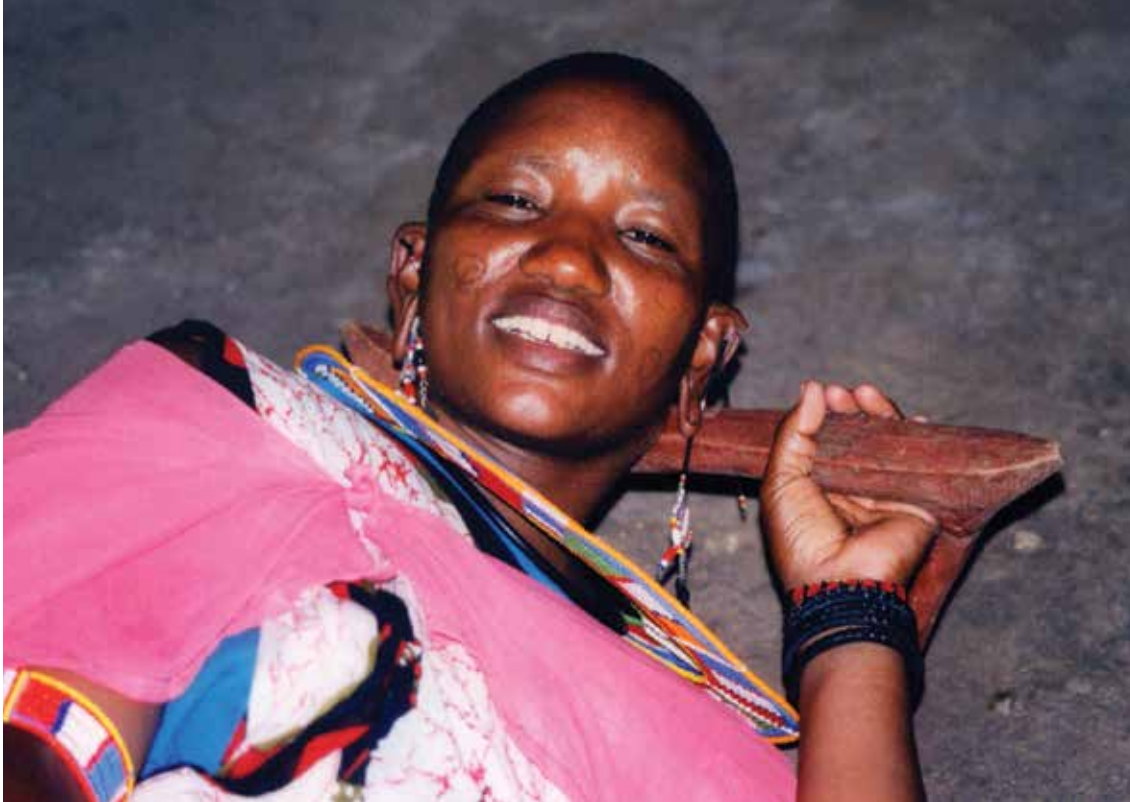
Kenijsko dekle v vasi Mgomongo