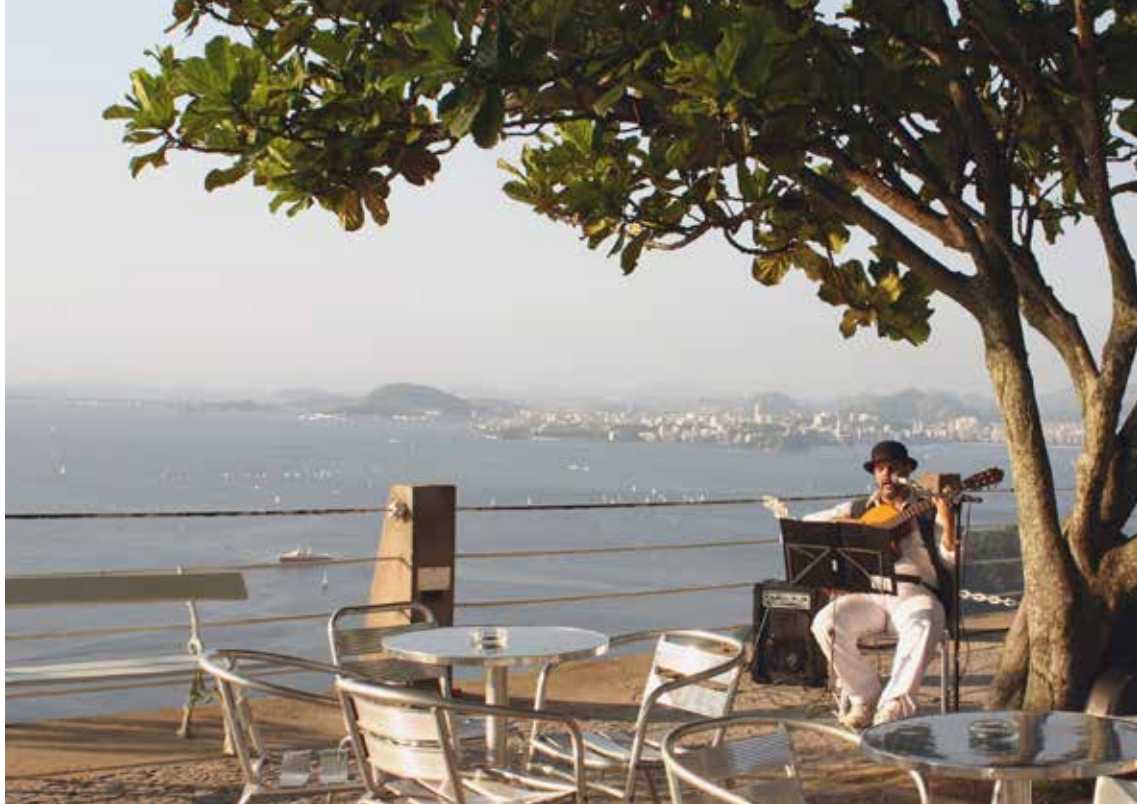
Rio de Janeiro

dajejo široke dolge peščene plaže, kjer se je zdelo, da se vse dogaja. Še več kot med tednom, ko se večinoma rekreirajo, je tam ljudi ob vikendih, zvečer, ko praznje oblečeni ustvarijo promenado. Iz vsakega kafiča odmeva živahna brazilska glasba in razpoloženi ljudje, ki pojejo in plešejo. Na plaži Copacabana je postavljen velik oder, kjer so teden prej nastopali Rolling Stonesi. Bosa sva se sprehajala po obalnem pesku in ugotavljala, ali imajo Brazilke res tako seksi ritke. Tomova analiza je bila, da zgoraj brez ni nobene, je pa veliko ostarelih lepotic, ki kljub temu, da je njihovo nekdanje občudovano ozadje sedaj podobno orehovi lupini, še vedno vztrajajo pri tangicah, ki s tem izgubijo tisti čar, za katerega so bile narejene. Res pa je, da je bilo nekaj tudi lepote kot jih je videti na reklamah za to plažo.