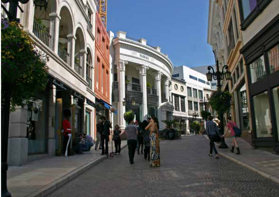
Ulica Rodeo Drive, Los Angeles

časa, da bi jih naštudirala. Med igralnimi avtomati in mizami strežejo zajčice. Ob ruleti bi lahko spretne krupjeje opazovala kar naprej. Tudi virtualna krupjeja ni bila slaba.