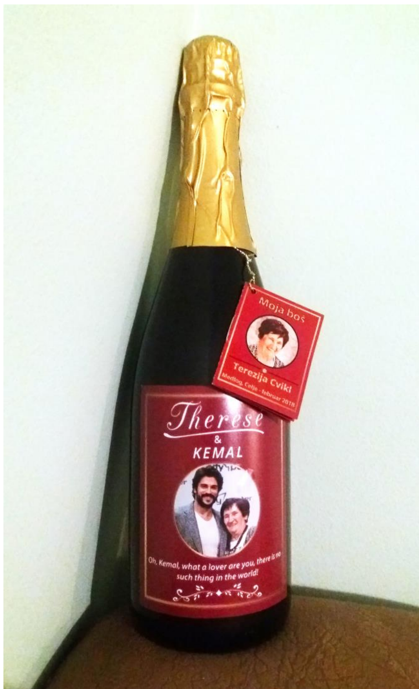
Priateljem in znancem