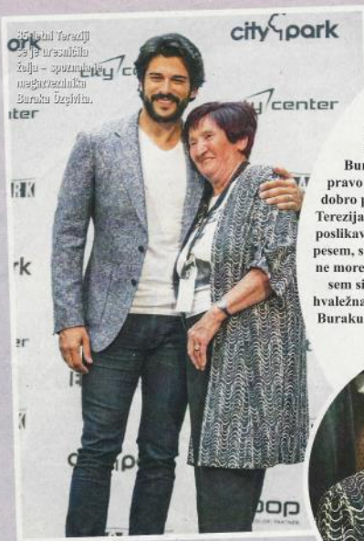
85-letni Tereziji se je urenila želja - spoznati nečestitnika Buraka Özçivita.