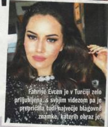
Fahriye Evci je v Turčiji zelo priljubljena, s svojim videzom pa je prepričala tudi največje blagovne znamke, katerih obraz je.

Foto: Članek o Tereziji in Kemal v reviji Lady