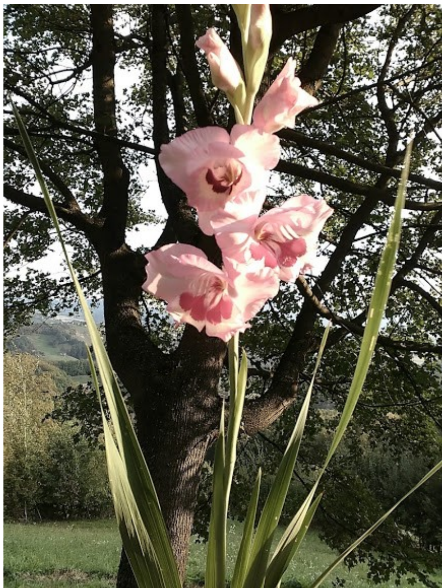
Zdenka Jagodič - Začuti srečo